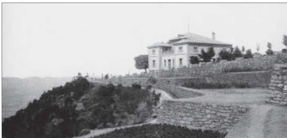
Postal del primer quart del segle XX en la qual es pot veure la construcció de la casa forestal a tocar de l'alzina que vèiem a la fotografia de 1907.

Amb el senyor Reig al capdavant de la División Hidrológico-Forestal, la casa forestal de la Pena es farà servir com a reclam per fer propaganda dels treballs forestals i de la importància del Cos d'Enginyers de Monts, com a avaladors d'una bona feina en les repoblacions i treballs hidrològics, serà com una aula d'educació ambiental d'aquella època. En un escrit 12 sobre la visita al bosc de Poblet realitzada pel company i amic d'en Reig, en Carles Camps i d'Olzinelles, marquès de Camps, el juny de 1911, ens parla sobre la casa forestal de la Pena: