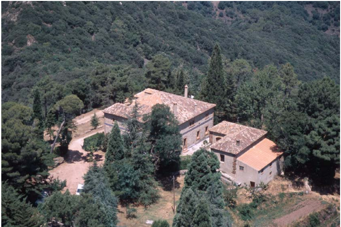
Vista de la casa Forestal de la Pena