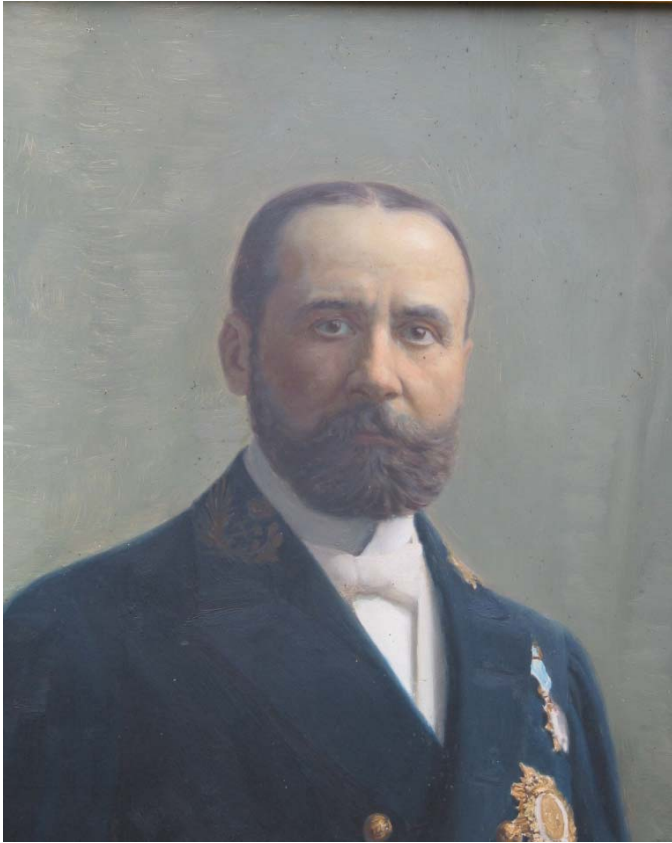
L'enginyer de monts Josep Reig i Palau, dirigi les obres de repoblació del bosc de Poblet a principis del segle XX