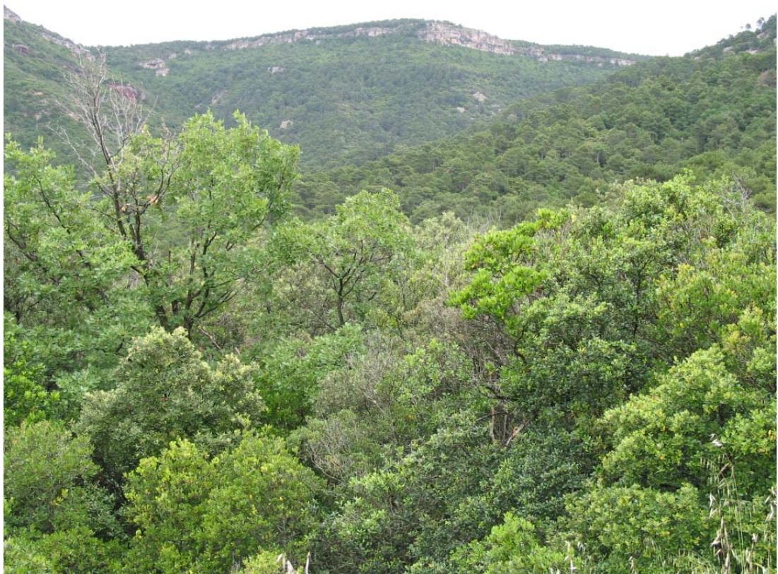
La vegetació del bosc de Poblet