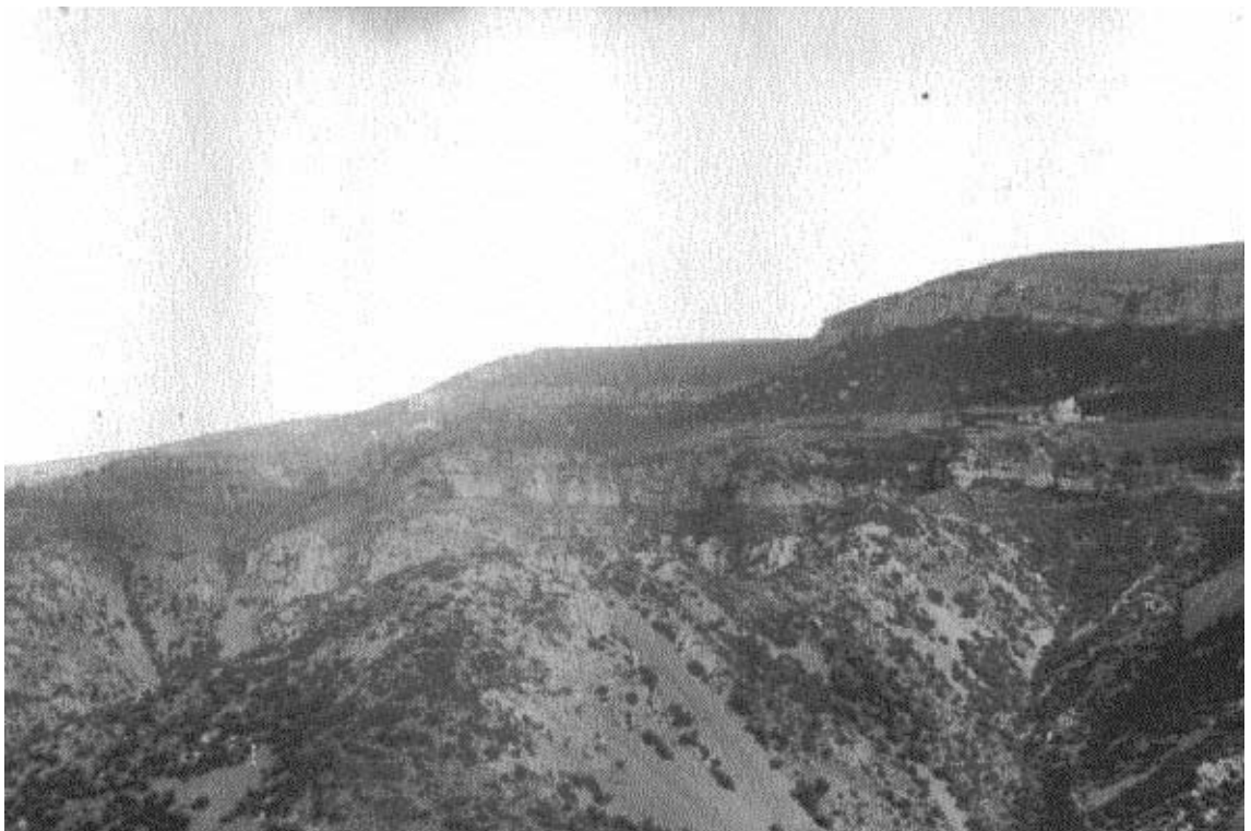
Fotografia de 1902 on s'aprecia de desforestació del bosc de Poblet