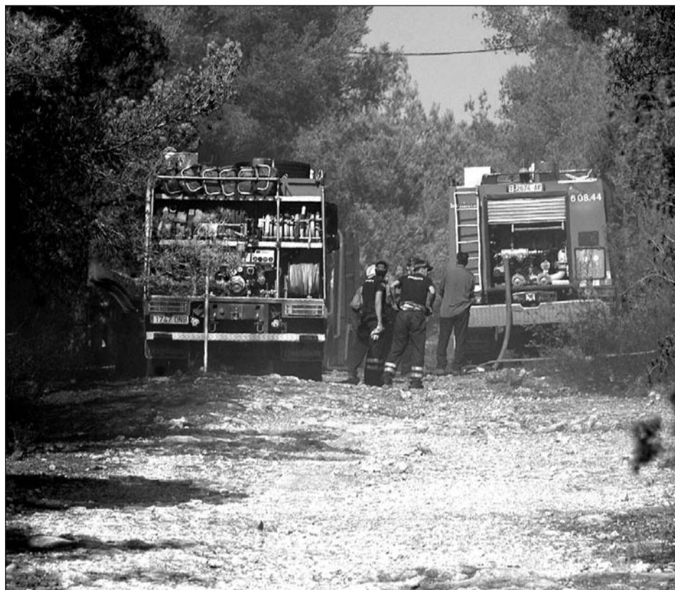
➔ L'accident de trànsit també va provocar un incendi als voltants de l'autopista AP-7 a la partida Mas d'Enric. ROSER SANS

Fins al lloc dels fets es van desplaçar una dotació dels