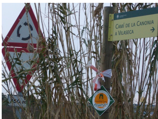
Indicació del camí de la Canonja a Vila-seca