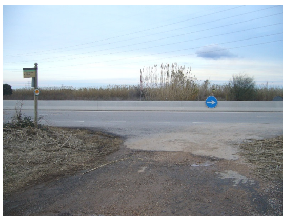
Vista del camí tallat en direcció la Canonja