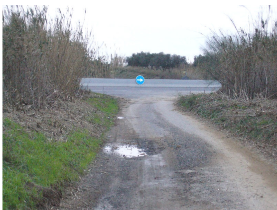
Vista del camí tallat en direcció Vila-seca

La mitjana de formigó que creua el camí suposa un impediment per la circulació pel camí i, a més a més, fa que les persones que vulguin creuar exposin la seva vida havent de creuar la carretera, tal i com es mostra en les quatre fotografies següents: