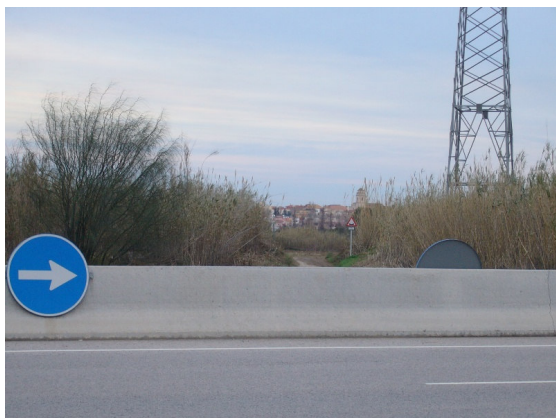
Mitjana de formigó que talla el camí.