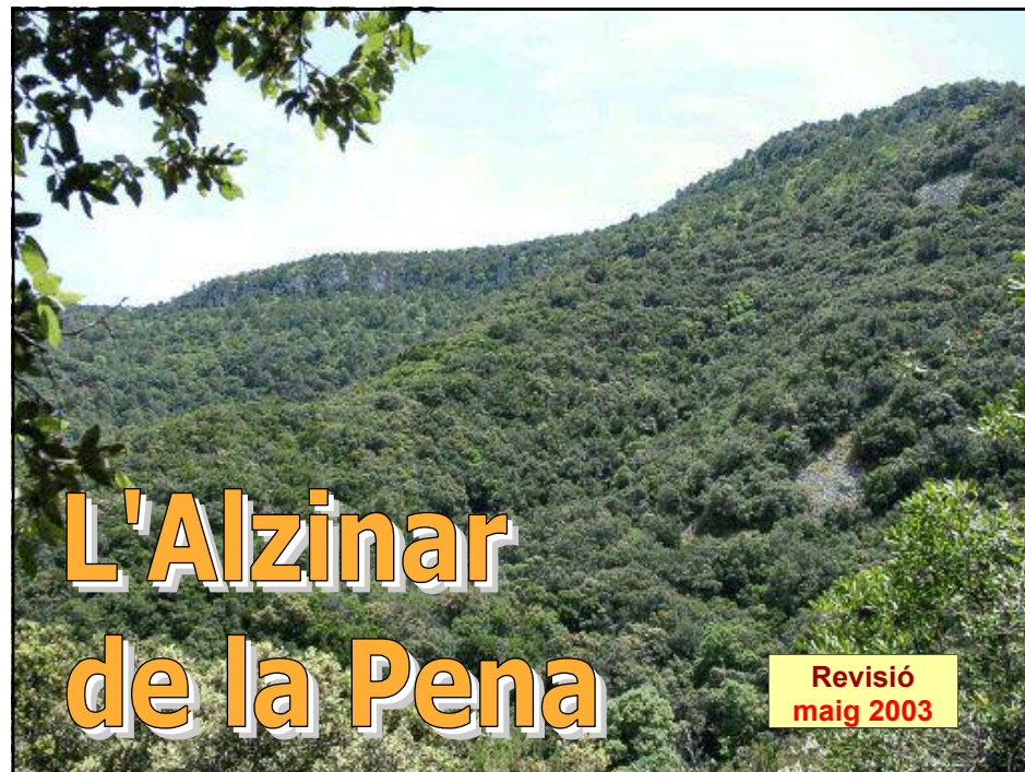
EXUBERANT BOSC D'ALZINES A LA PRIMAVERA

A. Boquè i J. Salafranca (abril 1998) (novembre 2000) (maig 2003) Bibliografia: Mapa Muntanyes de Prades - Editorial Piolet Itinerari per l'Alzinar de la Pena (3ª Edició) - C.E. Francolí (1982)