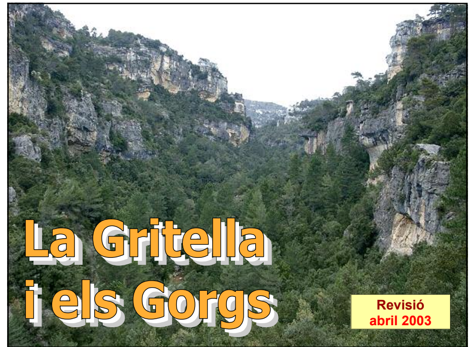
VISTA DEL BARRANC DE LA GRITELLA DES DEL GRAU DEL GRIS

Grup Excursionista del Camp de Tarragona