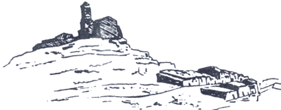
Serra de PRADES. MONT-RAL

Port Ainé: Esports d'aventura al Pallars Sobirà.