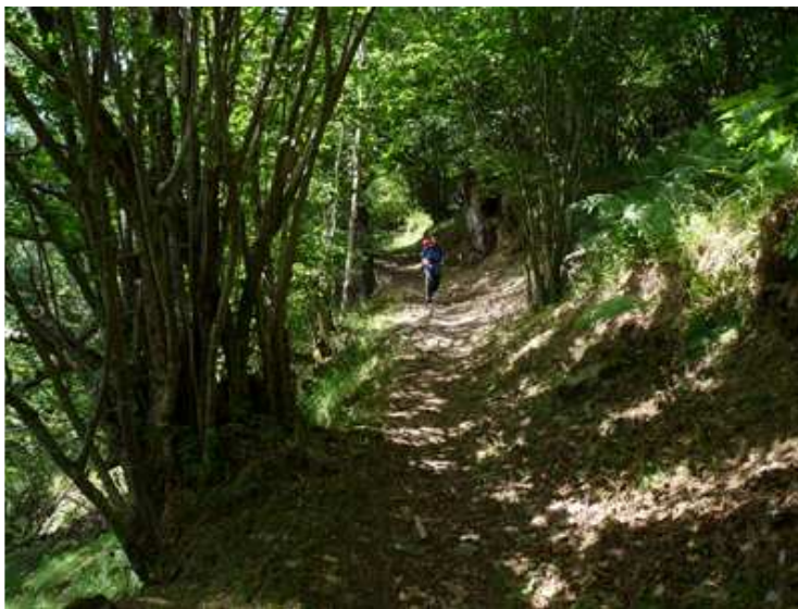
Baixant cap a Bossost

Aviat arribem a Porcingles . Poblet dispers i acollidor que just al tocar de la primera casa una font a l'esquerra i un banc a la dreta ens conviden a fer una mica de repòs, doncs el lloc és adient. Ja refets, deixem el camí principal per anar a l'esquerra pujant suaument fins els 1.300 metres des d'on contemplarem llunyana la teulada del refugi, això dóna ànims a seguir, doncs el cansament ja fa estona que ens fa la guitzia.