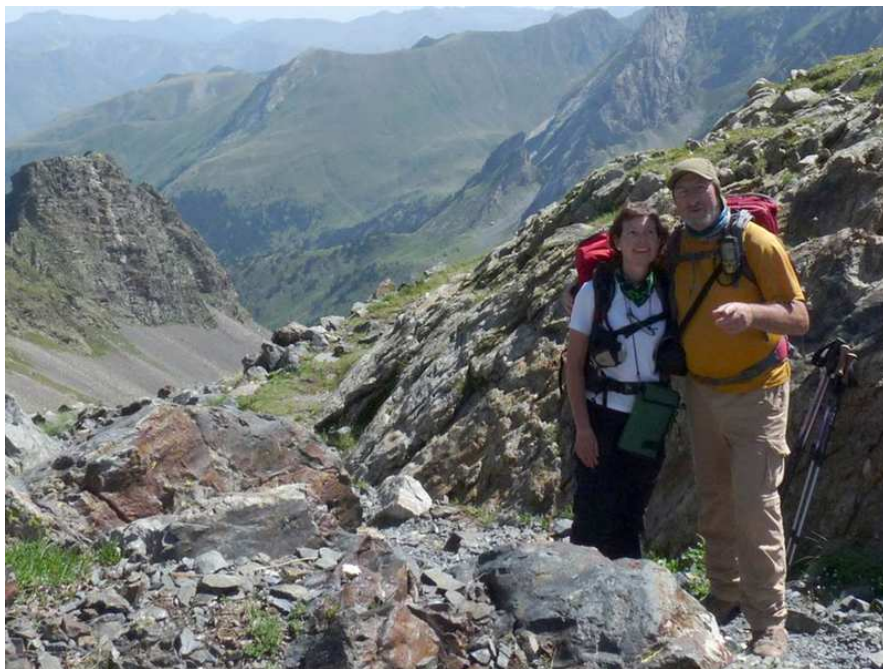
Al port de Vielha