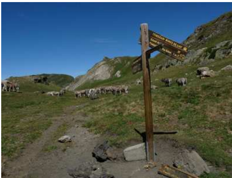
Coll de Guerri

De baixada comprovem que seguim el GR; uns nombrós grup de ciclistes que puja ens saluden i pregunten, estan esgotats i volen arribar a la cabana. És una pista, ampla i pedregosa que poc a poc ens fa arribar al Arriu Unhola o Riu Vermell, doncs durant el seu recorregut arrastra terres d'aquest color i produeix un fort contrast amb el verdor intens dels primers arbres que el voregen, des de dalt a la pista la panoràmica és encisadora i la monotonia de la baixada es veu trencada per aquest esdeveniment.