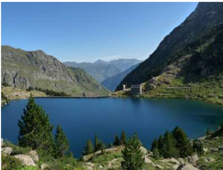
Estany i refugi de la Restanca

A partir d'aquí el GR marxa per la dreta a buscar el més directe possible el Port de Rius, a 2.340 metres d'alçària, el segon dels punts més alts del recorregut. Com que el nostre objectiu són els llacs superiors, rodegem l'estany per la seva riba esquerra fins que grimpem per una paret rocosa i ens enfilem al següent pla, i després de creuar el salt del Arriu del Estanh de Mar , novament grimpem i un altre cop, i així fins arribar a la nostra meta, el Estanh de Mar , la visió es fantàstica, aquella gran massa d'aigua envoltada de muntanyes com si no volguessin que se n'anés barranc avall, i al fons, presidint tan magnífic espectacle, el Massís de Besiberri; ara ens toca anar vorejant el llac per la esquerra. De vegades un corriol precedeix les nostres passes, altres hem de grimpar per les panxudes roques que s'endinsen a l'estany, i entre una cosa i altra quasi sempre hem d'anar sortejant els grans blocs despresos de la part més elevada de la muntanya per acció de l'erosió natural de l'aigua de pluja i el fred de l'hivern. El sender torna a grimpar, però aquest cop fort, molt fort, casi una vertical per roca descomposta i terrosa de vegades, en pocs minuts pugem 250 metres, fins els 2.500 de la Colhada del Estahn de Mar .