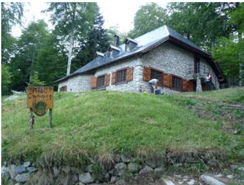
Refugi de Conangles

Tornem damunt les nostres petjades del dia anterior fins arribar al pal, i anem cap a l'esquerra (ahir hi varem fer cap venint per la dreta). Només al inici de l'ampla pista, un panell del Conselh Generau d'Aran ens sorprèn per la quantitat de diners que es varen invertir fa 4 anys en millores d'aquest camí que ells l'han batejat com "Camí Natural".