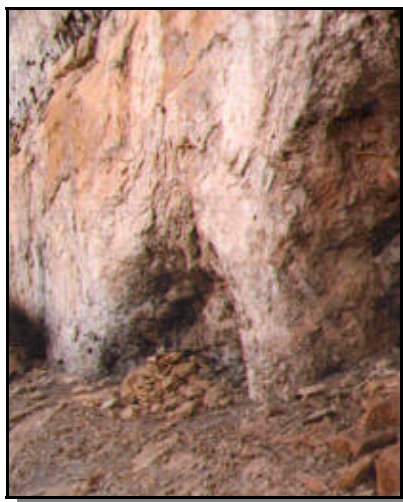
Vista parcial Cova del Portalloret

En front de la pista hi ha un camí carreter al costat d'un camp d'avellaners: tot i que està marcat amb un pas barrat del PR, és el camí que hem d'agafar, trobant-se a pocs metres marques de PR pel terra i els arbres. Seguim doncs el sender, arribant a una bassa al costat d'un torrent. Creuem el torrent pel