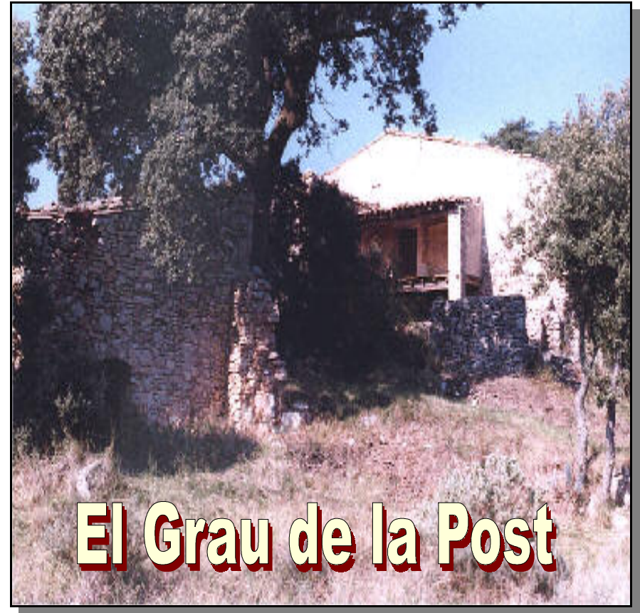
El Mas de la Bàrbara vist per la part posterior on es pot distingir l'entrada als corralis i el porxo de la casa .

RECORREGUT: Els Masets - Grau dels Corralis Nous Molí de l'Esquirola - Barranc de la Gritella Grau de la Post - Mas de la Bàrbara Alzina monumental del Mas de la Bàrbara