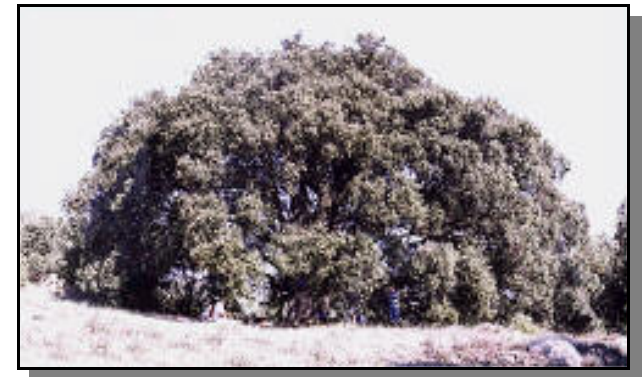
L'alzinia del Mas de la Bàrbara, ha estat declarada arbre monumental, tenint uns 25 metres de diàmetre de capçada i 3,30 m. de volt de canó.

hi ha una pedra gran i arrodonida per l'erosió amb una ratlla de color indefinit. Travessant la llera, estem a uns dotze metres de l'entrada del grau, encara que no la veiem degut a la vegetació. Vorejant la vessant dretana del barranc trobarem al menys dues entrades de sender: una és perpendicular a l'entrada del grau i l'altra fa un angle a l'esquerra i a uns cinc metres, gira a la dreta, trobant-se amb un sender força fressat i una columna de pedres d'uns vuitanta centímetres d'alçada que fa de fita. Ja som a l'entrada del Grau de la Post que queda amagat, precisament per lo poc conegut que és. El grau és una esclatxa en el congost del barranc de la Gritella sobre el cingle de la mateixa Serra. Comencem pujant fort i girant cap a la dreta per un recingle des d'on podem admirar el panorama del barranc així com el quasi