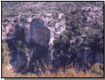
.. el quasi impossible Grau del Gris.

Anem camí de Siurana i en arribar a la carena de la Serra, deixem els cotxes a la partida dels Masets, prop del camí a Prades . Seguim la pista per davant de la granja cap el grau dels Masets com indica un pal, seguint les senyals grogues i blanques. Al cap d'uns cinc minuts trobem un maset a la dreta i al costat la fondalada que porta al grau dels Masets . Uns metres mes endavant trobem un indicador pirogravat indicant la seua entrada. Seguim per la pista i en tres minuts