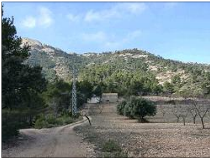
Mas d'En Torner i perfil de la baixada

Eixim de Gandesa pel carrer de Sant Miquel (mirant a l'Ajuntament, el de l'esquerra) que coincideix amb la carretera de Bot. Al final del carrer, trobem un arbre gran i girem a l'esquerra i uns vint metres endavant agafem per la dreta el camí del Calvari que seguim durant un minut, agafant a l'esquerra una pista de terra i tot seguint les marques blanques i grogues del PR que a hores d'ara estan perfectament remarcades en tot el recorregut. Veiem a la nostra dreta l'Ermita del Calvari. Seguim rectes i als pocs minuts trobem a la dreta una senda que entra pel costat d'un conreu i aviat puja fort. Cal estar atents a aquesta bifurcació que ens portarà a la carena en cinc minuts. Seguint el camí de carena, trobem en uns sis minuts la Font de l'Heura (aigua no potable). Seguim pujant per l'esquerra, per un camí ben marcat i entre pins. Només cal seguir els senyals blanc i groc del PR. En uns vint-i-cinc minuts de senda entres crestes de roca i bosc, arribem a una pista que seguim pujant per la dreta fins arribar en cinc minuts al Coll del Puig Cavalier , on hi ha la caseta de l'antena de comunicacions. Seguim el sender a tocar paret per l'esquerra de la caseta i mirant a la roca que forma el cim, enfilem el sender que puja fort durant uns cinc minuts i passant per tres esglaons grimpadors ens