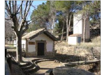
La zona d'esbarjo de La Fonteta

per la dreta el Barranc de l'Infern que baixa cap a l'Oest. Pugem un xic, sempre propers a la carena i aproximadament als deu minuts, arribem a la collada del Barranc de les Caragoles . Baixem pel comellaret, seguint el traçat de la senda que discorre per la vessant dretana de la Vall del Mas d'En Sunyer . Als vint minuts des de la collada, arribem a una esclotxa de la cresta rocosa des d'on podem albirar bona part del recorregut de tornada. Travessem cap a la part solana, des d'on veiem els conreus de la Coma del Mas d'En Torner , on tenim que baixar. De moment, seguim flanquejant, sense perdre gaire alçada. En uns quatre minuts, som al primer llog transversal, que puja del Mas d'En Torner i el dipòsit d'aigua d'abastiment de Gandesa. El seguim i davallam força, per un traçat esveradís per l'abundància de grava sobre la roca.