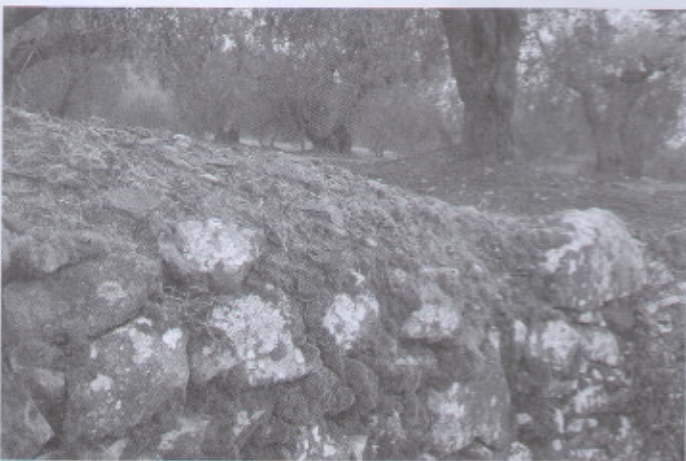
Marges de pedra seca situats al voltant del terme municipal. D'esquerra a dreta i de dalt a baix: a la vall de l'Ermida, al Peu del Bosc i a la Cometa. Les dues últimes fotos corresponen al Bosc del Comú abans de la seva reforestació.