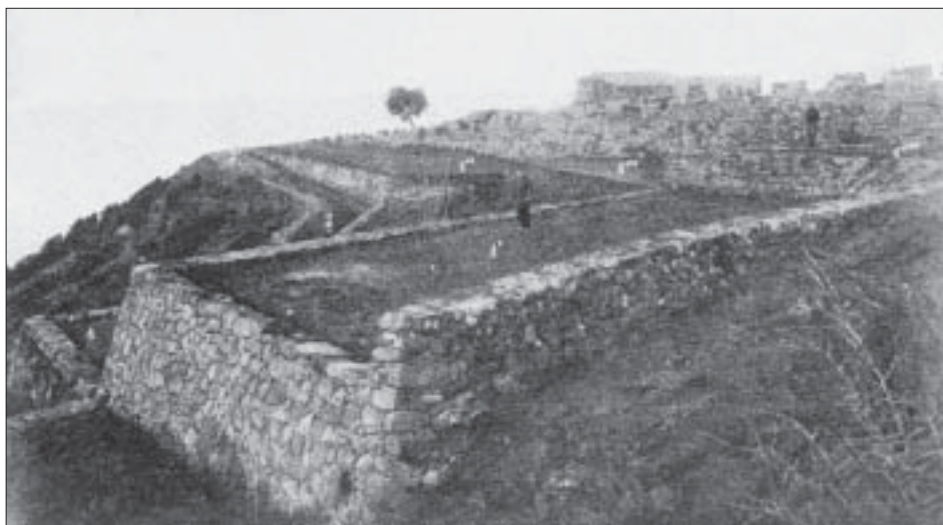
A la fotografia de 1907 es poden veure els bancals acabats de construir per al viver i les restes de l'antiga granja de la Pena separades uns quants metres de l'única alzina que hi ha a la fotografia.