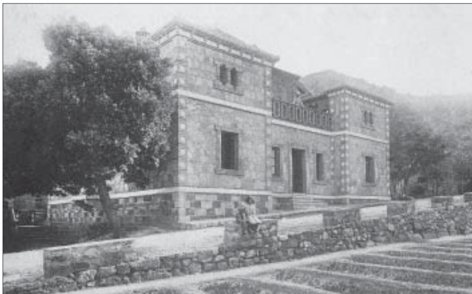
Postal de la façana de la casa forestal de la Pena al primer quart del segle XX.

Se ha formado un cuartel con el barranco de la Pena porque es un lugar muy frecuentado por los excursionistas, entre los que ha existido el propósito de pedir que se