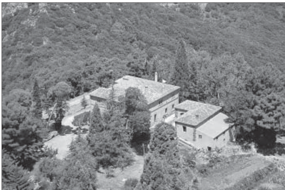
Vista actual de la casa forestal des del mirador.