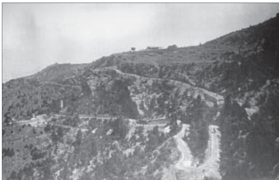
A la fotografia de 1907 es pot apreciar la construcció de la pista forestal fins a l'antiga granja de la Pena.

Amb el nou segle començà una nova política forestal encaminada a la repoblació dels terrenys forestals de les capçaleres dels rius i a treballs hidrològics destinats a evitar les fortes riuades i l'erosió del sòl. Així tenim que l'any 1901 es crea el Servicio Hidrológico-Forestal, que havia de ser l'encarregat de portar a terme aquestes repoblacions i correccions hidrològiques. A Catalunya les primeres actuacions d'aquest nou organisme foren a les dunes del golf de Roses i a les capçaleres dels rius Segre i Francolí.