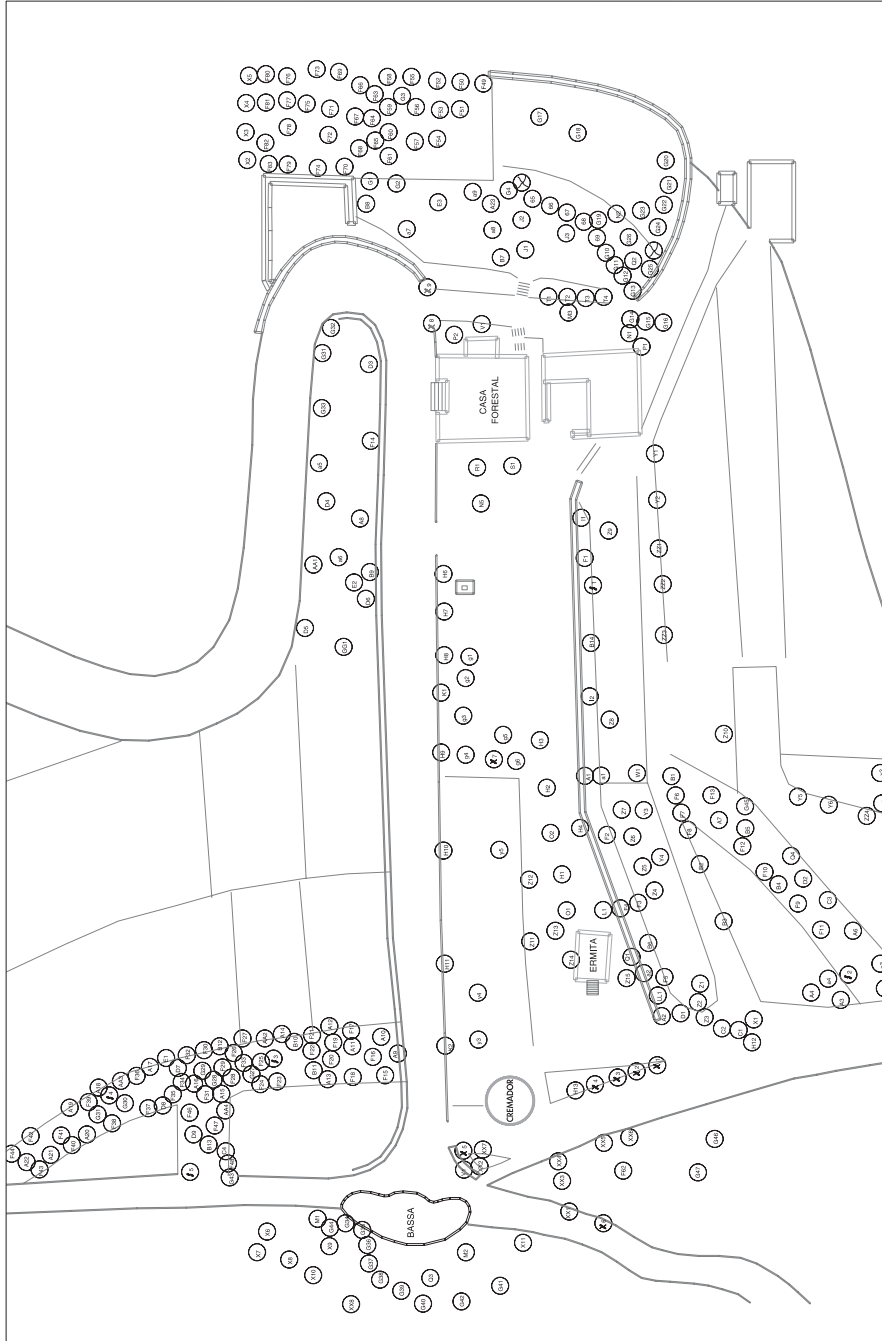
Plànol de la distribució de les espècies realitzat per J. M. Hernández a partir del croquis de l'inventari.