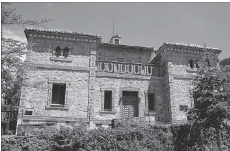
Façana principal de la casa forestal de la Pena.