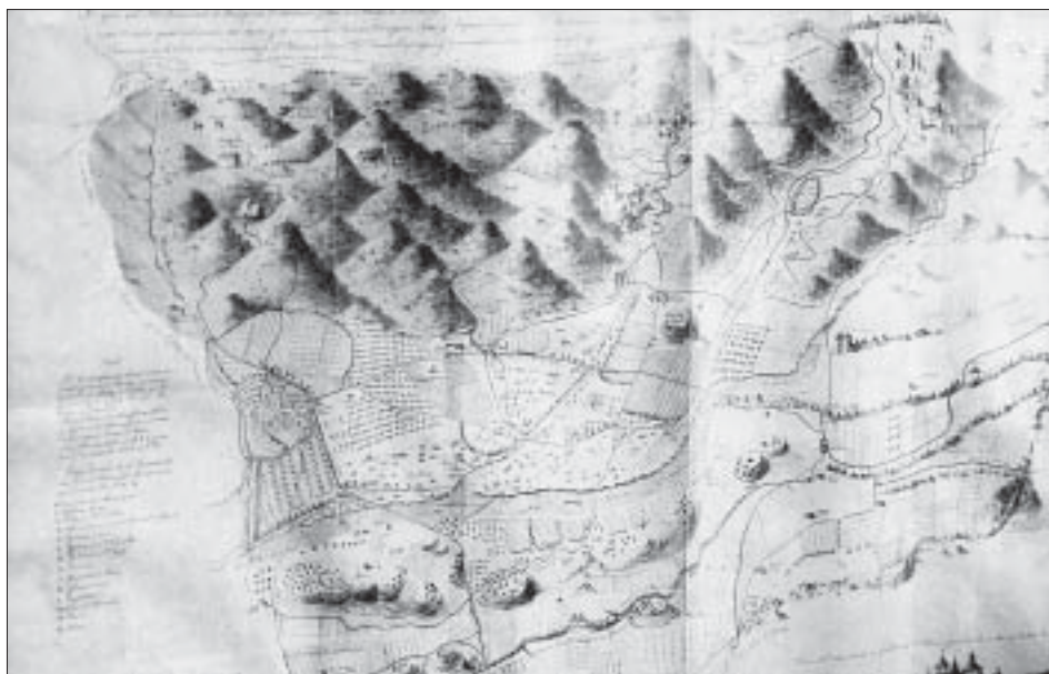
Gravat del segle XVIII de l'antic terme de Poblet, original de l'arxiu del monestir de Poblet.

Tenim constància que l'any 1756 a la granja de la Pena hi vivien guardabosc del monestir, segons una declaració davant notari, 6 del 12 de maig d'aquell any, de dos guardabosc habitants de dita granja sobre un afer ocorregut l'any 1755 i relacionat amb el robatori de llenya.