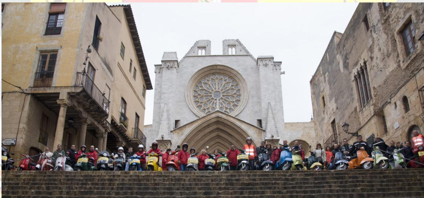
Bonica imatge al peu de les escales de la Catedral

intercanvi d'obsequis entre ambdues entitats, al final sorteig dels regals donats pels nostres col·laboradors i fi de festa amb molt bona sintonia i fins la propera trobada.