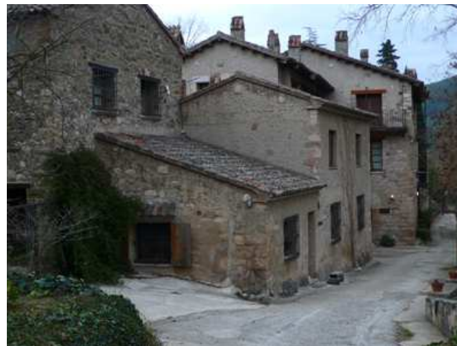
Mas de Monravà

L'edifici més antic és la torre mestre, una construcció de planta rectangular, segurament amb un petit annex, situada al punt més alt del planell on es va construir el castell. Aquesta torre pot ser datada en el segle XII. El 1646, a la Guerra dels Segadors, les autoritats castellanques van obligar a desmantellar el castell.