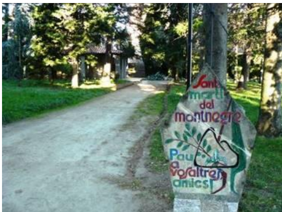
Entrada i ermita de Sant Martí de Montnegre

El diumenge 14 de novembre sortim de Reus per la AP7 fins a San Celoni i més tard per una carretera – pista fins a l'ermita de Sant Martí de Montnegre. Al arribar el primer que es troba és un pàrquing comú, a la tornada estava ple a vessar, aquí es pot deixar el cotxe, uns metres més avall trobem el restaurant Montnegre, nosaltres deixem el cotxe al seu pàrquing particular per clients, doncs encomanem taula per dinar a la tornada, i uns metres més endavant s'hi troba l'ermita de Sant Martí de Montnegre, la qual visitem abans de començar l'excursió.