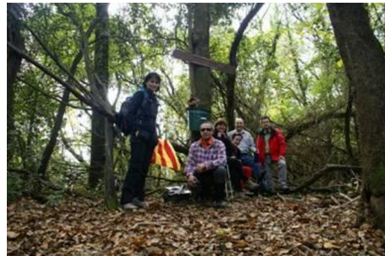
Turó d'en Vives, 759 m. Maresme

Només ens resta pujar cap a la dreta buscant unes fites grosses i unes fites de terme que ens indiquen un corriol que en deu minuts ens deix al cim. Poc a poc i amb unes tres hores, després d'haver fet unes marrades acumulant uns dos-cents metres de desnivell més del compte, arribem al nostre destí, al Turó d'en Vives, de 759 m d'alçada i que és el cim més alt de la comarca del Maresme.