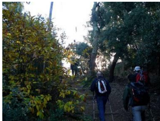
Sortida pel mig d'un bosc d'alzinar surer

Quan són dos quarts de deu del matí sortim de davant el pàrquing comú, per uns esgraons, pel GR-5 i de seguida el camí ens porta per un bosc preciós d'alzines sureres. En poc més de deu minuts arribem a una altra pista a on hi ha un pal indicador del GR-92 i GR-5, el nostre camí segueix pel GR-5 pujant a l'esquerra tot seguint la pista fins arribar al coll de Basses a on hi ha unes alzines grosses. El camí continua recte segons hem arribat al coll.