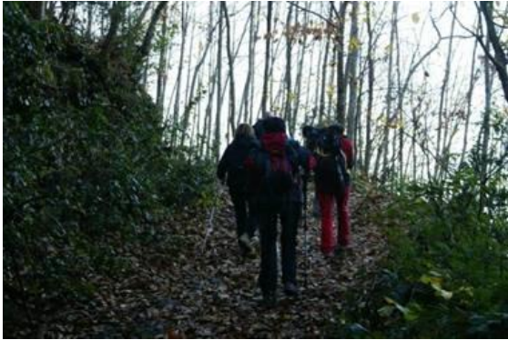
El camí és tot ell una catifa de fulles