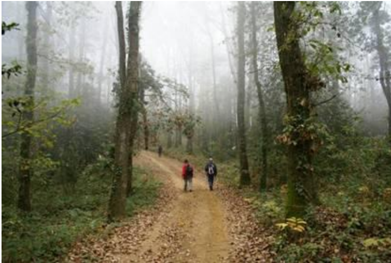
Pujant al Turó Gros

africans i de fulles grans, que són dues espècies de roures que hi conviuen en aquesta serra.