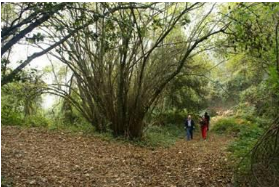
Punt on s'acaba la pista i a la dreta comença el camí fins el Turó d'en Vives.

A partir d'ara canviem de vessant i de comarca, deixem el Vallès Oriental i entrem al Maresme. En molt poca estona, uns tres minuts, arribem a un lloc anomenat Faigs d'en Preses, aquí deixem una pista a l'esquerra per la qual pujarem més tard al Turó Gros, però ara seguim pujant a la dreta i en uns cinc minuts arribem a un coll, a on deixem el GR-5 que marxa avall a l'esquerra, i seguim recte per la pista fins arribar a un petit pla que li diuen Prat Perellò, a on hi ha un faig gros. En aquest punt la pista davalla però tot seguit, a uns deu o quinze metres, surt una pista a l'esquerra, l'agafem fins al final, no és molt llarga, uns cinquanta o cent metres i finalitza en una mena de collet a on trobem uns avellaners molt grans abandonats, estem just al peu del Turó d'en Vives.