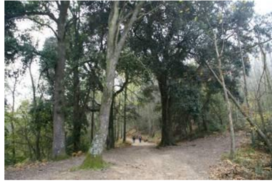
Les alzines del coll de Basses

A partir d'ara canviem de vessant i de comarca, deixem el Vallès Oriental i entrem al Maresme. En molt poca estona, uns tres minuts, arribem a un lloc anomenat Faigs d'en Preses, aquí deixem una pista a l'esquerra per la qual pujarem més tard al Turó Gros, però ara seguim pujant a la dreta i en uns cinc minuts arribem a un coll, a on deixem el GR-5 que marxa avall a l'esquerra, i seguim recte per la pista fins arribar a un petit pla que li diuen Prat Perellò, a on hi ha un faig gros. En aquest punt la pista davalla però tot seguit, a uns deu o quinze metres, surt una pista a l'esquerra, l'agafem fins al final, no és molt llarga, uns cinquanta o cent metres i finalitza en una mena de collet a on trobem uns avellaners molt grans abandonats, estem just al peu del Turó d'en Vives.