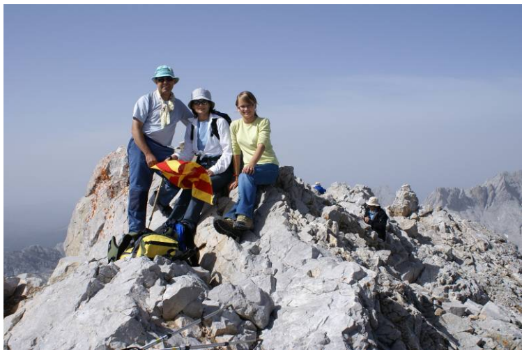
Peña Vieja 2.619 m. (CANTABRIA).