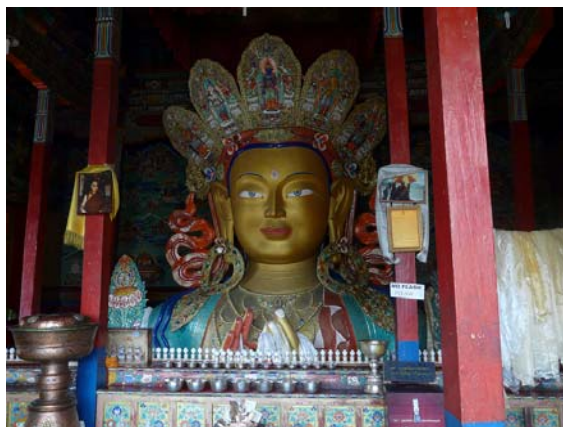
Buda del monestir de Tikse