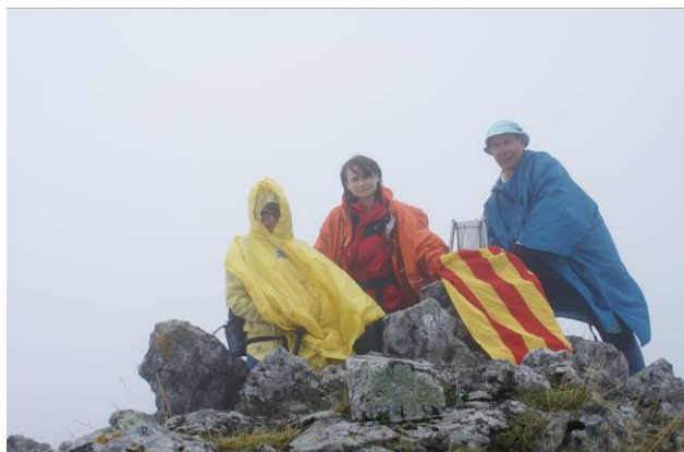
Aitxurri 1.551 m. (GUIPÚZCOA – GUIPUZKOA)

Tot el recorregut ens va costar unes cinc hores de caminar reals.