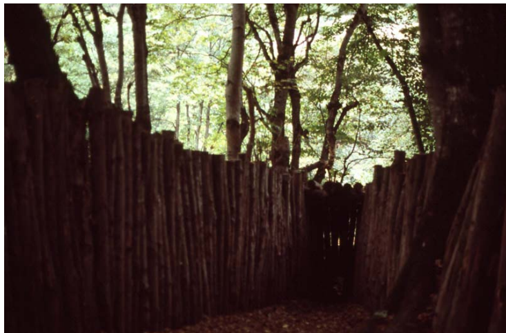
El Chorco de los lobos

Durant el segle VIIIè el poder i la influència d'aquest monestir va augmentar degut fonamentalment a la vinguda de molts refugiats de la invasió àrab. D'aquella època, any 776, daten el comentaris Apocalíptics del famós Beato de Liébana.