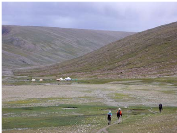
Arribant a Nimaling, 4.720 m

Ens dirigim a la capçalera de la vall, l'espai es va obrint i l'horitzó s'eixampla. Tots els pics que ens rodegen ultrapassen els 5.000 metres, encara que el límit inferior de les neus perpètuas sembla estar pels 5.500 m. Portem unes tres hores quan arribem a una llacuna rodejada de vaques peludes que semblen iaks. Un parapet circular de pedra ens defensa del vent i serveix per seure una estona i gaudir de la visió més propera de la gran massa nevada del Kang Yatze i tota la serralada que l'acompanya. D'aquí surt el sender que s'atansa al campament base dels que volen escalar-lo. Arribar a l'avantcim per un llarg pendent nevad no sembla difícil. A continuació, una esmolada cresta d'aspecte ferotge barra els pas al cim principal.