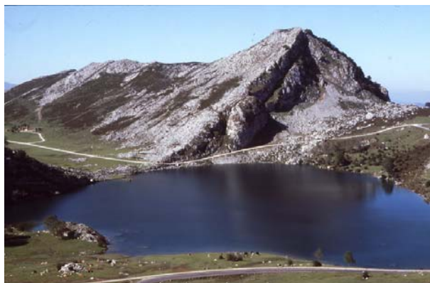
Llac de Enol