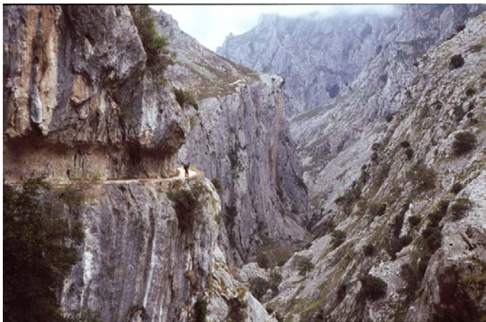
Garganta del Cares

A partir de l'altiplà la baixada és sostinguda, la perspectiva que s'albira és molt ampla amb els prats curulls de ramats i amb el poble de Sotres sempre al fons de l'esguard. Finalitzada la baixada passem primer pel pont de Moyeyeres sobre el riu Duje, creuem més tard els hivernals de