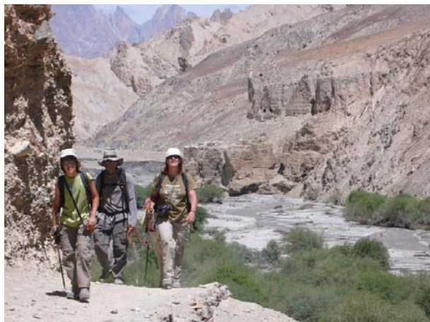
Per la vall de Markha

El divendres 4 resulta ser la jornada més llarga del trek, 22 km, que farem en set hores i mitja. Al migdia es fa una mica feixuga per la forta calor en un cel sense núvols. Anem guanyant alçada i tot i que el camí és còmode