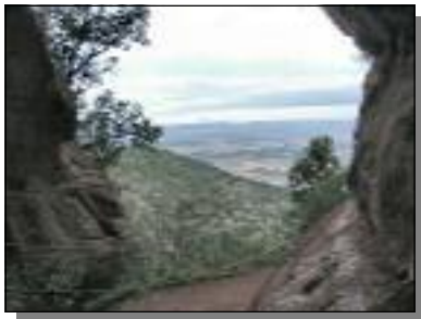
Vista de la Conca des de la Cova de Nialó

per una Senyera, on poden albirar-se les serres de la comarca, des de la del Tallat fins el Tossal Gros , Miramar i les de Poblet , tenint al darrere les cingleres de la Penya . La Roca de la Foguera pren el nom perquè hi havia el costum d'encendre una foguera la nit de Sant Joan i fins que no hi era abrandada, no es calava foc a cap mes, ni a Montblanc ni a la Conca. L'Ermita fou reedificada per la princesa catalana Na Elionor d'Urgell (1.414) que, en la Cova de Nialó (corrupció del seu nom N'Elionor) passà dura penitència i fou la primera ermitana del lloc. La restauració de l'Ermita i la del camí a la cova es deu als Ermittans de Sant Joan , una associació constituïda per montblanquins que des de fa onze anys puguen a fer feina, pel