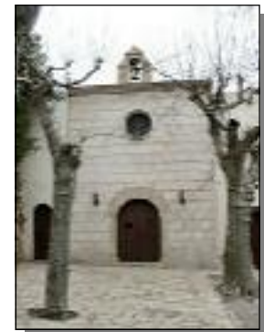
Ermita de la Stma. Trinitat