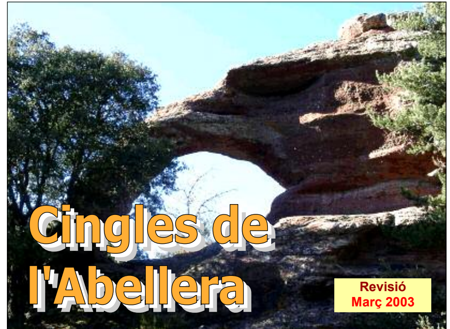
LA ROCA FORADADA DE PRADES

Fotos: Mònica Salafranca - Traçat cartogràfic amb GPS: Josep Salafranca