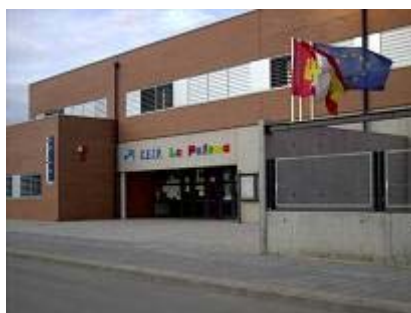
CP La Paloma

http://centros6.pntic.mec.es/cea_azuqueca.de.henares/index.htm