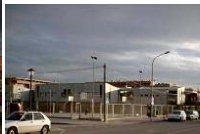
Vistas del Centro de Adultos y del IES Domínguez Ortiz