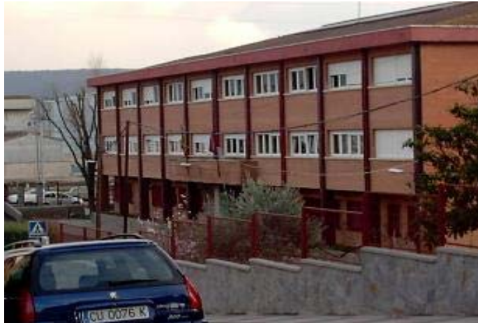
CP Virgen de la Soledad